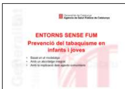
Presentació per a l'acte de signatura de compromís