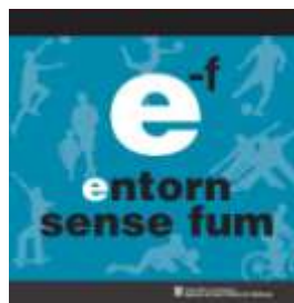
Placa per entorns esportius