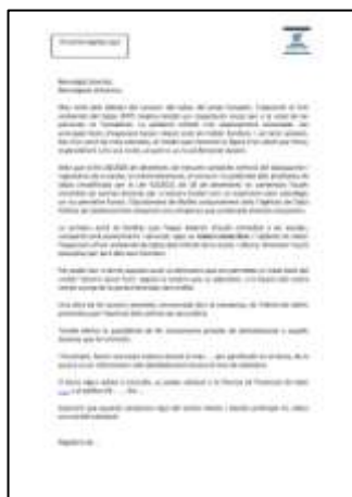
Carta explicativa per centres educatius