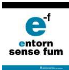
Placa d'ús general