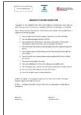
Manifest: model per clubs esportius