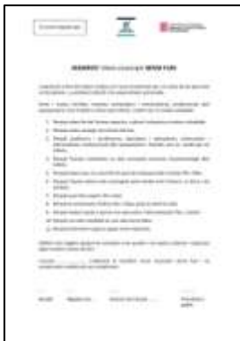
Manifest: model per centres educatius