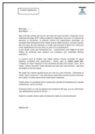
Carta explicativa per clubs esportius