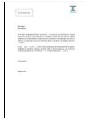
Carta demanat signatura del manifest